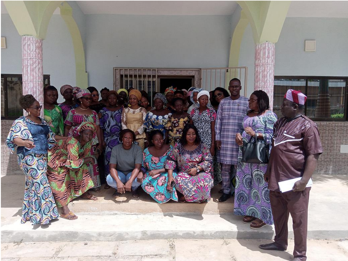
Figure 3 : Photo de famille session 2 des femmes