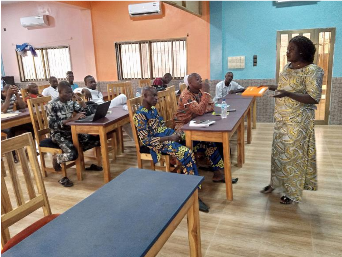
Figure 5 : Restitution des travaux de groupe