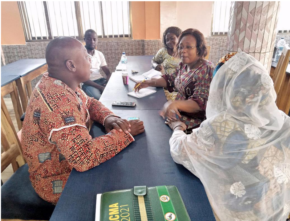
Figure 4 : Images montrant les participants en situation de travaux pratiques