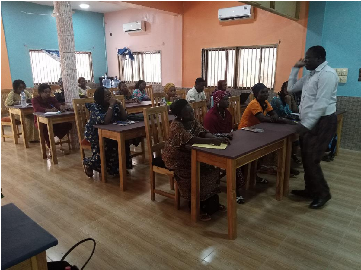
Figure 2 : Photo des participants en salle de formation